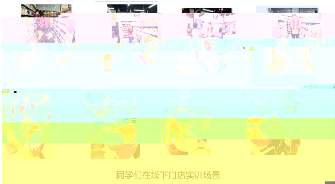
同学们在线下门店实训场景