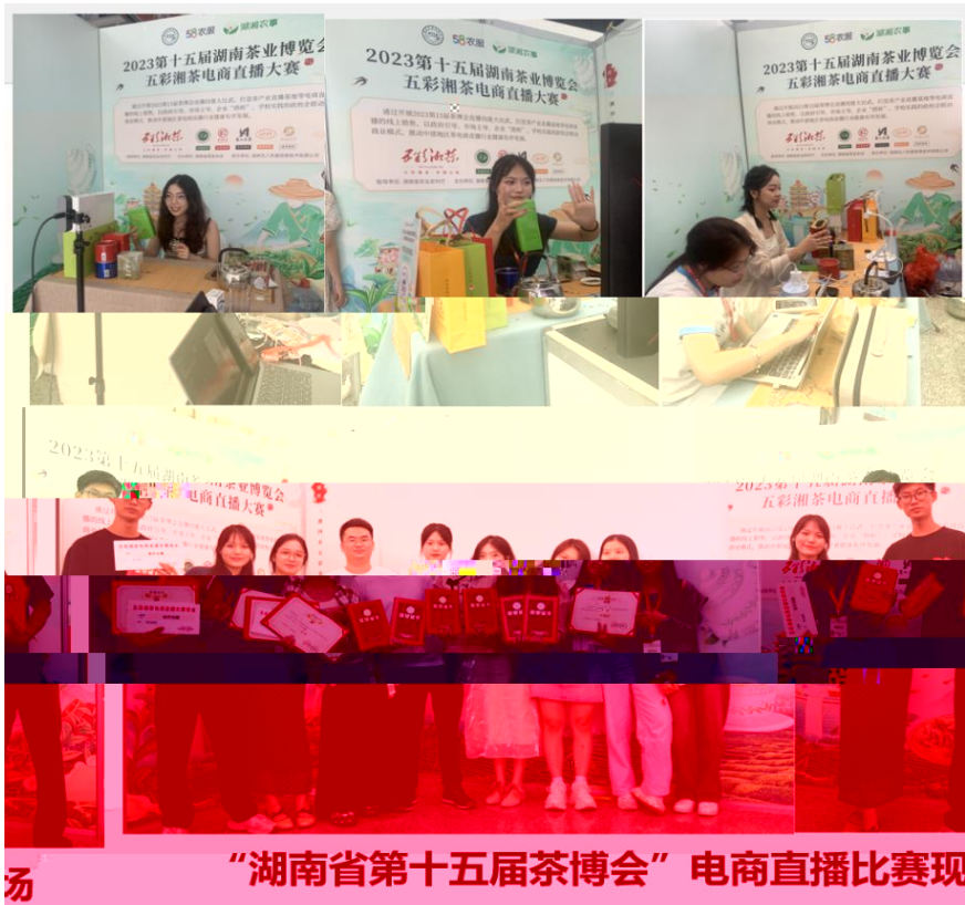
“湖南省第十五届茶博会”电商直播比赛现场