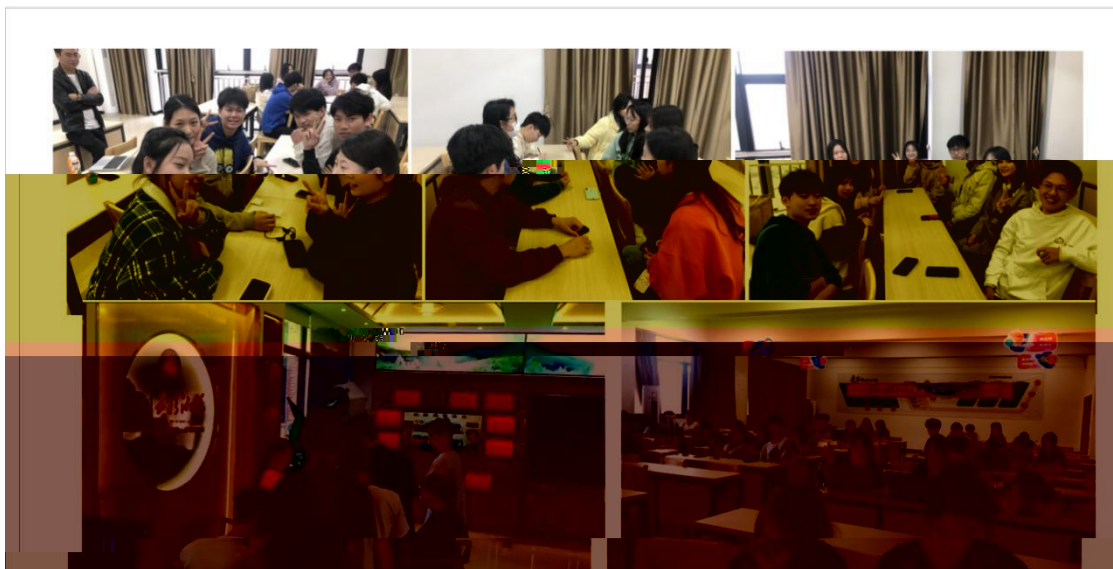
同学们在实训室实训场景